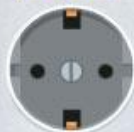
MODELO EUROPEU Usado por 45% da população mundial em 104 países