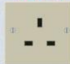
MODELO INGLÊS Usado por 8,5% da população mundial em 41 países