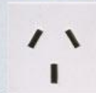
MODELO AUSTRALIANO Usado por 21% da população mundial em 15 países