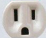
MODELO AMERICANO Usado por 12% da população mundial em 46 países